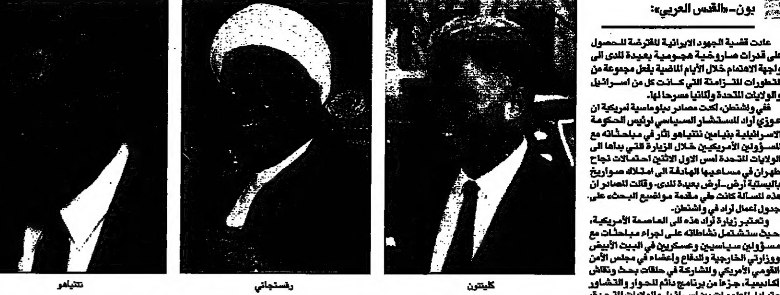
يونس- القدس العربي